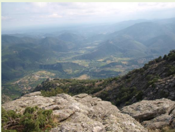
vlakbij in de omgeving in natuurgebied de Caroux

Wanneer we elkaar ontmoeten voor de workshop dan zijn de mogelijkheden om dat binnenshuis te doen. Maar natuurlijk ook buiten op de terrassen en het terrein. Het meest inspirerend is misschien wel boven in de bergen in de paradijselijke omgeving van la Fage, wanneer het weer een beetje meewerkt. Mogelijkheden genoeg in een volop inspirerende omgeving, waar de hemel en de aarde in een prachtig evenwicht elkaar uiterst subtiel raken.