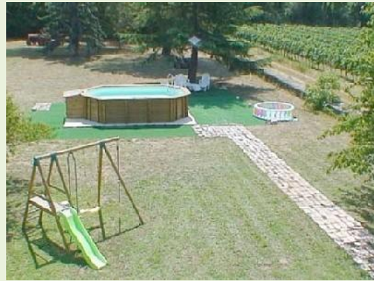
terrein met zwembad