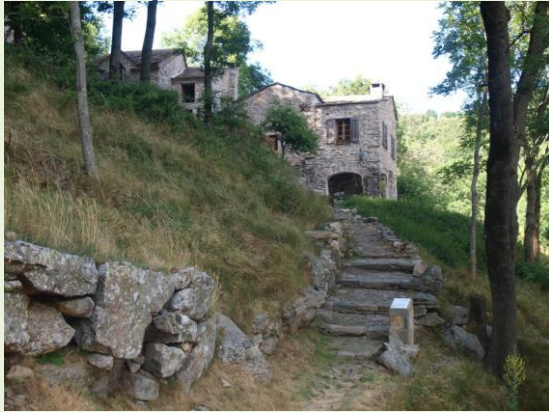
gite in la Fage voor koffie en thee