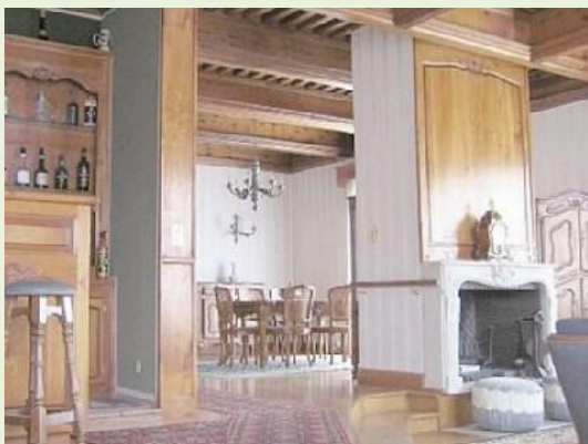
interieur, grote living en salon

Zeer mooi gelegen grote villa iets buiten de stad Bédarieux. Geheel vrijstaand, zeer groot terrein en gelegen aan de rivier de Orb. Villa is vanaf de begane grond en de eerste verdieping rondom het hele huis voorzien van terras. Van