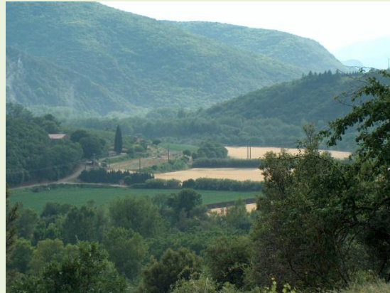
uitzicht in la Borie Basse