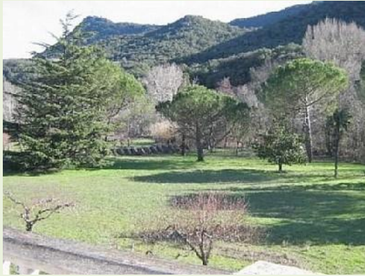
grote tuin en vrij uitzicht