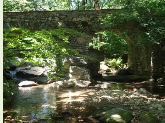
entree van la Fage