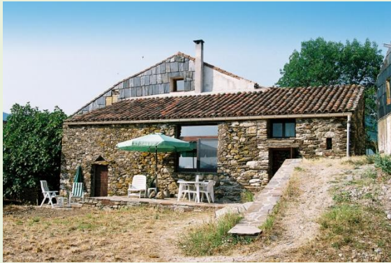
maison en pierre la Borie