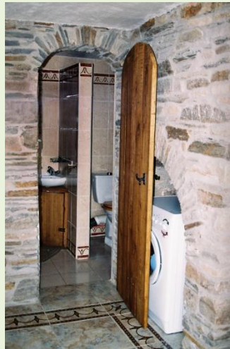
hal naar toilet en douche