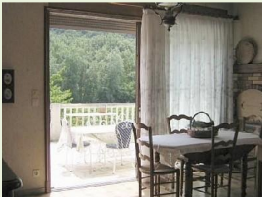
vanaf eetkamer naar terras