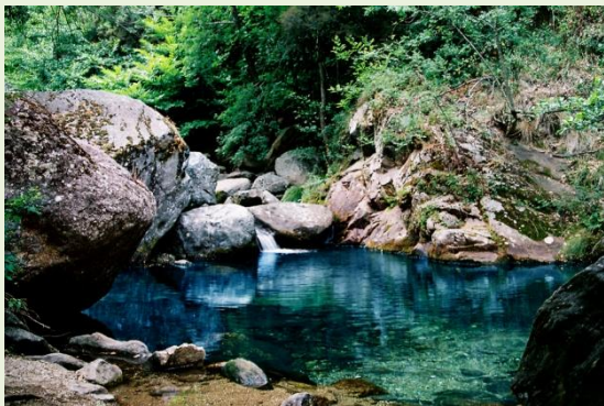
zwembassin in Colombieres