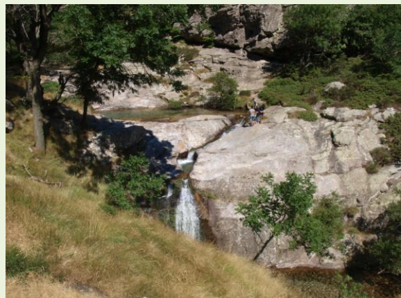
boven in bergen in la Fage