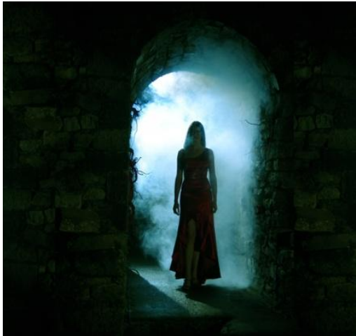
Lilith, de verborgen vrouw

Een andere overeenkomst tussen Lilith, de eerste vrouw, en de zwarte maan is dat beide principes in aanvang verborgen zijn. Beiden verborgen zowel op collectief als op individueel niveau. Eva is, als oermoeder van het vlees, in het collectieve onbewuste van vele culturen duizenden jaren lang de zichtbare en geaccepteerde vrouw. De andere helft van het vrouw zijn – Lilith – is in diezelfde tijdspanne verborgen gebleven in het collectieve, maar ook individuele onbewuste, waar zij niets anders kan dan in opgesloten eenzaamheid wachten op het licht van bewustzijn dat haar bevrijding betekent. Een bevrijding die de verhoudingen tussen mannen/vrouwen, mannen/mannen en vrouwen/vrouwen zal veranderen. Zowel mannen als vrouwen dragen de twee oervrouwen Lilith en Eva in zich. Mannen projecteren deze archetypen naar buiten in de vrouwen die zij naar zich toetrekken. Evenals vrouwen, maar vrouwen kunnen zich daarnaast met deze twee archetypen ook identificeren.